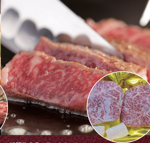
松阪牛赤身ステーキカット