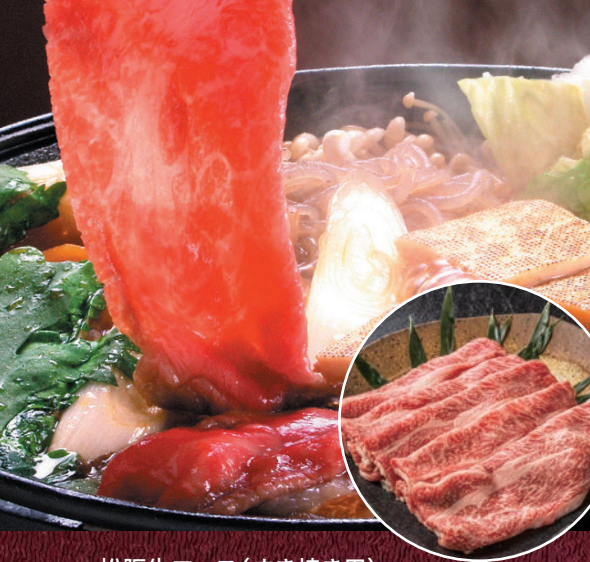
松阪牛ロース(すき焼き用)